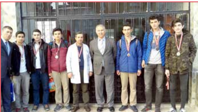
VOLEYBOL A GRUBU İKİNCİSİ 12/A