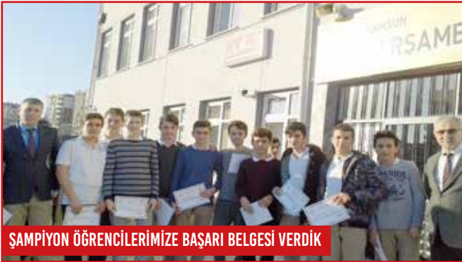
ŞAMPİYON ÖĞRENCİLERİMİZE BAŞARI BELGESİ VERDİK