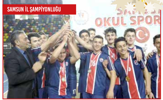
SAMSUN İL ŞAMPİYONLUĞU