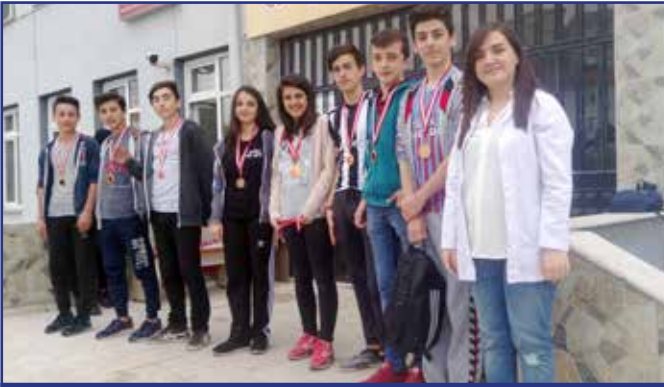
VOLEYBOL B GRUBU ÜÇÜNCÜSÜ 9/D