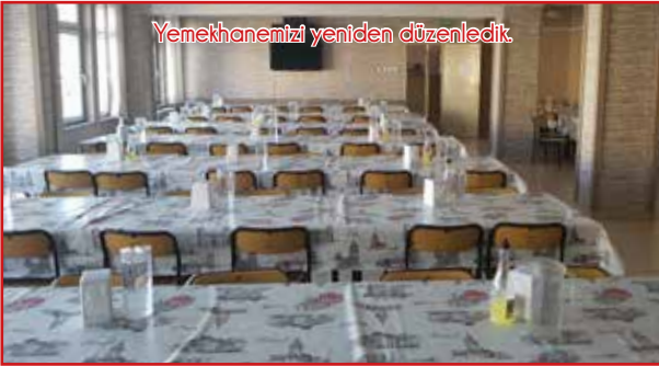
Yemekhanemizi yeniden düzenledik.