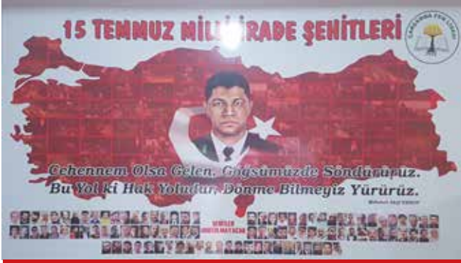
15 TEMMUZ MİLLİ İRADE KÖŞESİ