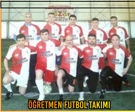
ÖĞRETMEN FUTBOL TAKIMI

İlçe Milli Eğitim Müdürlüğü'nün organize ettiği Kurumlar Arası Futbol Turnuvasında okulumuz Çarşamba dördüncüsü