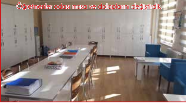
Öğretmenler odası masa ve dolaplarını değiştirdik.