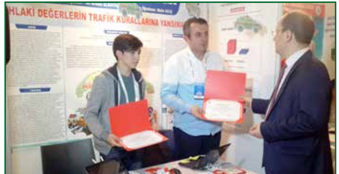
TÜBİTAK Türkiye Finalleri - Ankara