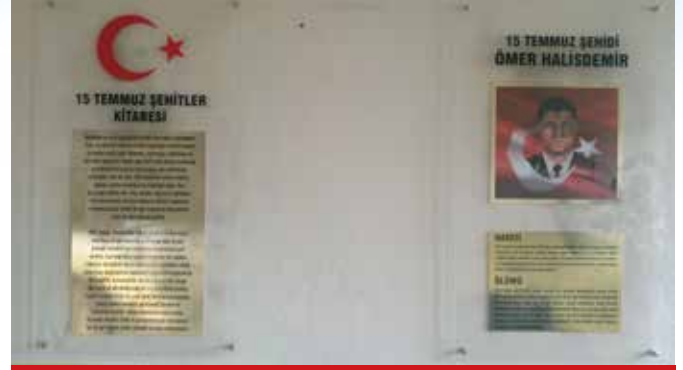
ÖMER HALİSDEMİR KÖŞESİ

"15 Temmuz Hain Darbe Girişimi"nin ülkemiz ve milletimiz için ne ifade ettiğini çeşitli etkinliklerle anlatarak öğrencilerimizi bilinçlendirdik. Bu etkinlikler çerçevesinde;