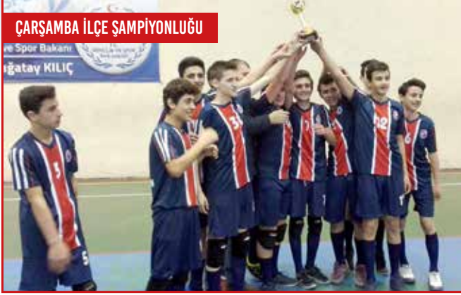
ÇARŞAMBA İLÇE ŞAMPİYONLUĞU