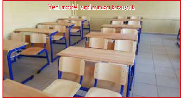
Yeni model sıralarımıza kavuştuk.