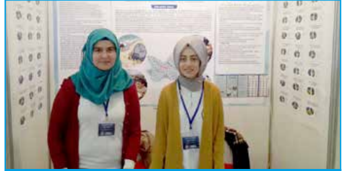
TÜBİTAK Samsun Bölge Sergisi