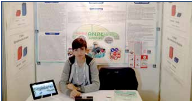
TÜBİTAK Türkiye Finalleri - Ankara