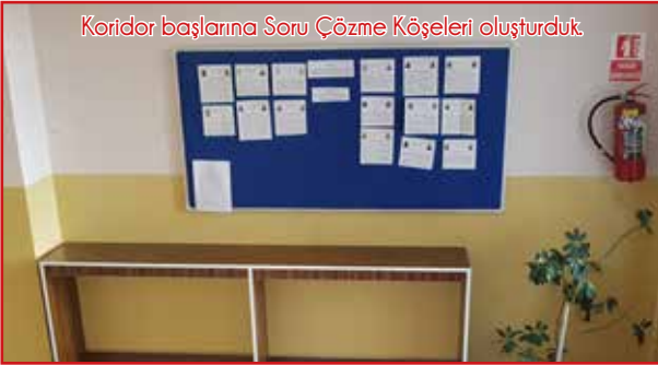
Koridor başlarına Soru Çözme Köşeleri oluşturduk.