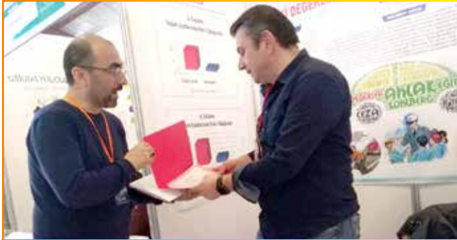
TÜBİTAK Samsun Bölge Sergisi