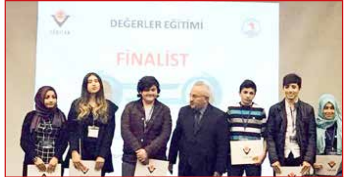
TÜBİTAK Samsun Bölge Sergisi Finali