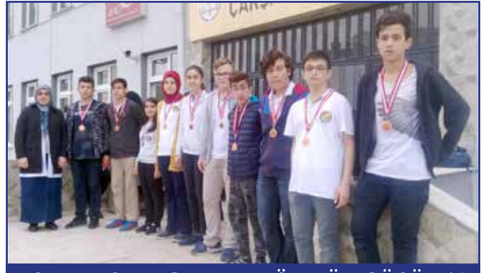
VOLEYBOL B GRUBU DÖRDÜNCÜSÜ 9/A