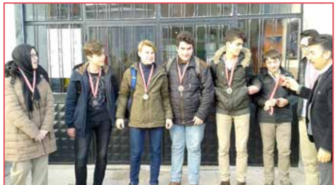
VOLEYBOL A GRUBU ÜÇÜNCÜSÜ 11/B