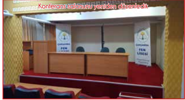
Konferans salonunu yeniden düzenledik.