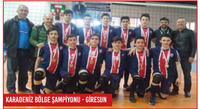
KARADENİZ BÖLGE ŞAMPİYONU - GİRESUN