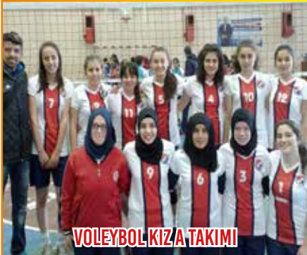
VOLEYBOL KIZ A TAKIMI

İlçe üçüncüsü olarak maçları tamamladık. Grubumuzda yaptığımız maçlarda Yıldırım Çınar Mesleki ve Teknik Anadolu Lisesi ve Dikbiyık Anadolu Lisesi ile karşılaştık. Yarı finalde Ali Fuat Başgil Anadolu Lisesi ile karşılaştık. İlçe üçüncülüğü için Bulutoğlu Anadolu Lisesi ile karşılaştık.