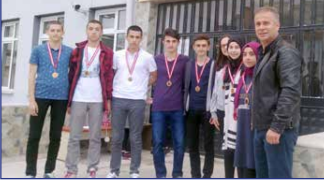
VOLEYBOL B GRUBU BİRİNCİSİ 10/A