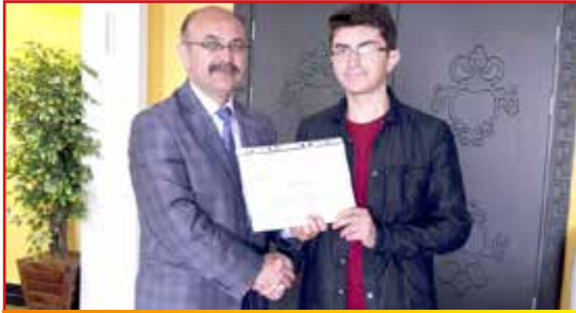
İlçe Kaymakamından Belgesini Alırken