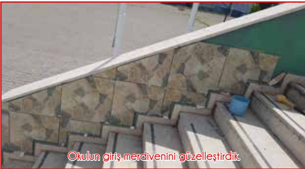
Okulun giriş merdivenini güzelleştirdik.