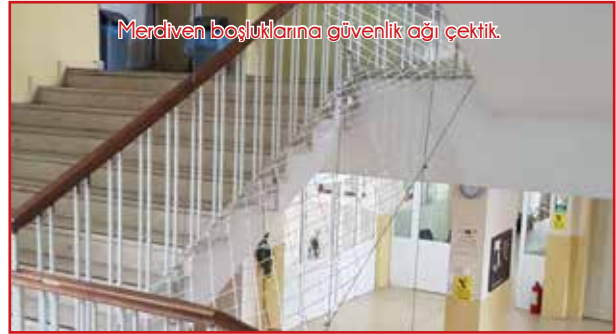
Merdiven boşluklarına güvenlik ağı çektik.