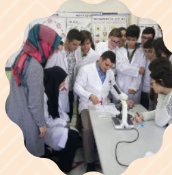
Üst Düzey Akademik Eğitim