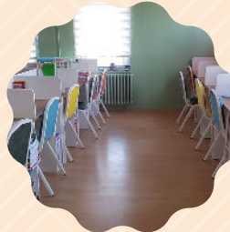
Pansiyonda Barınma İmkânı..