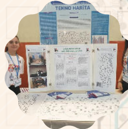
TÜBİTAK, Teknofest projeleri