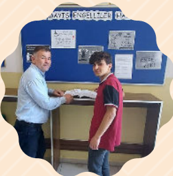
Eğitim Koçluğu ve Kişiyeye Özel Değerlendirme