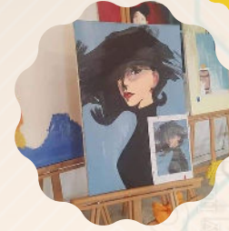
Sosyal ve Sportif Faaliyetler