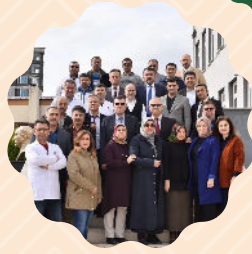
Uzman Eğitim Kadrosu